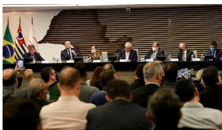
Anúncio de Chamada Pública para a Retomada e Incremento de Parques Tecnológicos no Brasil