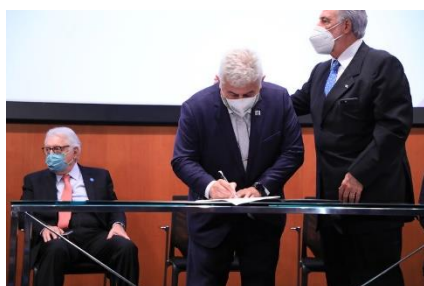
Ato de Assinatura de parceria entre o FINEP/MCTI e Sebrae