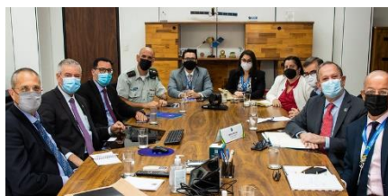
Visita do embaixador de Israel