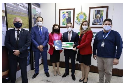
Reunião com o Senador Wellington Fagundes - PL/MT