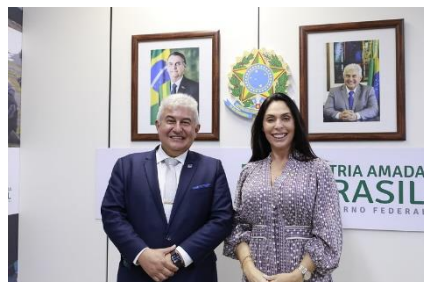
Reunião com a Deputada Federal Geovania de Sá - PSDB/SC