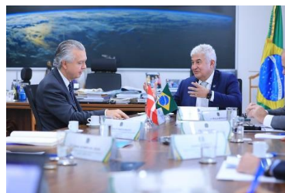
Reunião com Rodrigo de Azeredo Santos, Embaixador do Brasil em Copenhague/Dinamarca