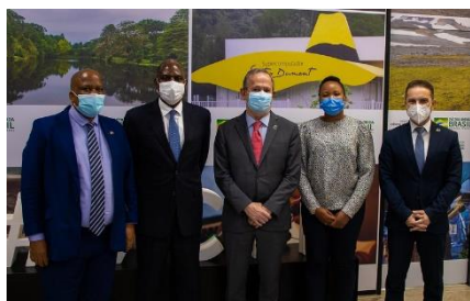
Reunião com autoridades de países africanos