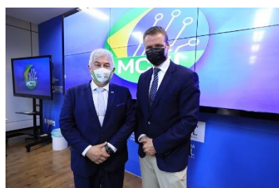
Reunião com Odd Magne Rudd, Embaixador da Noruega no Brasil