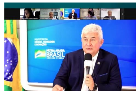
Abertura WEBHALL: Estratégias para o enfrentamento de variantes de SARS-CoV2