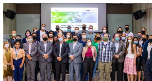
Reunião - SEFIP