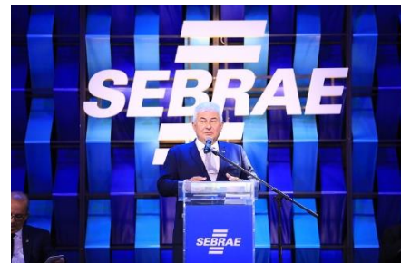
Cerimônia em homenagem aos 15 Anos da Lei Geral da Micro e Pequena Empresa (LC123/2006)